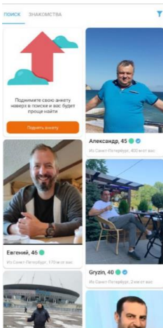
Рисунок 4 – Вкладка «Поиск»

3.2.11. Для ввода параметров поиска, в правом верхнем углу нажмите на пиктограмму «Фильтр» и укажите параметры поиска (местоположение, пол, возраст, вес, ориентация, телосложение и пр.). Фильтр применяется автоматически при закрытии формы ввода параметров. На вкладке поиска отобразятся только анкеты, которые подходят по условиям фильтрации.