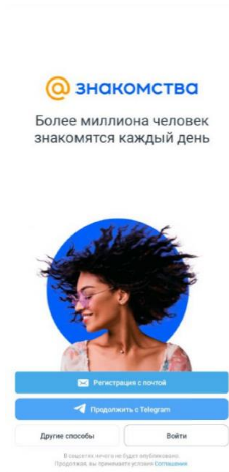
Рисунок 2 – Экран регистрации и авторизации

3.2.2. Запустите мобильное приложение (п. 3.1.1). Перед вами появится экран регистрации и авторизации (рис. 2).