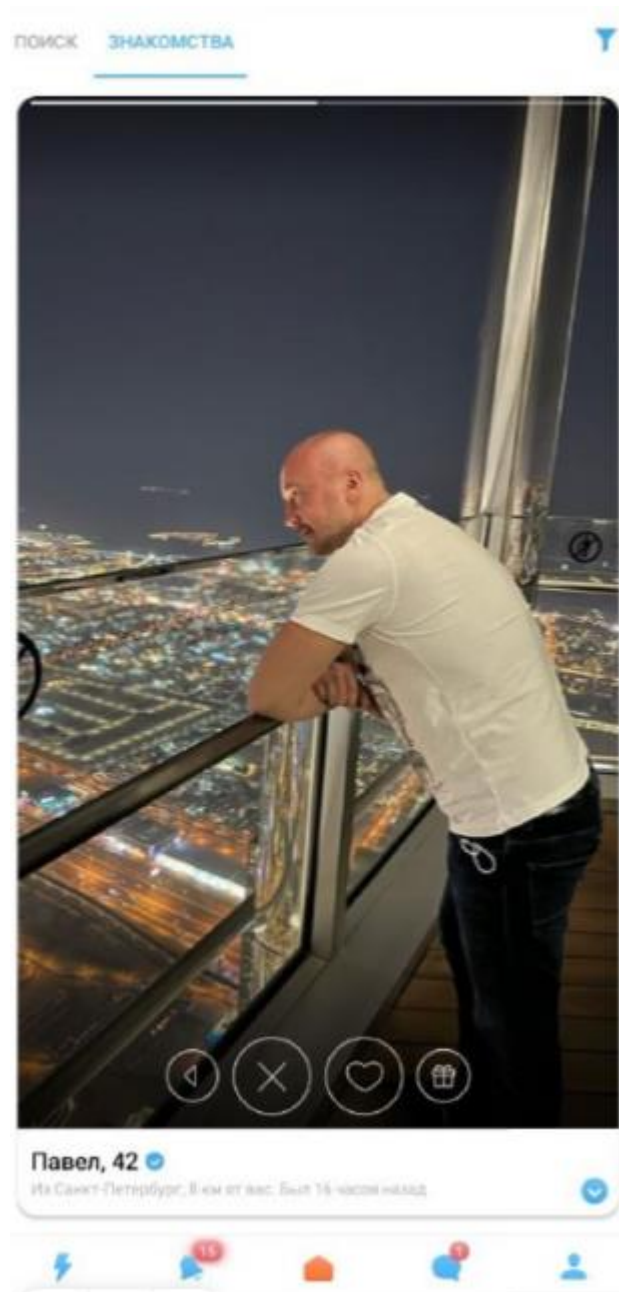
Рисунок 3 – Анкета пользователя

3.2.9. Для перехода и просмотра своей анкеты нажмите на пиктограмму «Моя анкета» в правом нижнем углу. В анкете отображается вся указанная при регистрации информация (имя, возраст, местоположение, цели знакомства и пр.). Можно отредактировать информацию, а также указать дополнительные параметры. Анкета содержит дополнительные функциональные элементы, которые могут быть доступны при получении VIP-статуса.